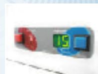
Painel cl Aquecimento