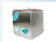
Também Fornecido em Aço Inox