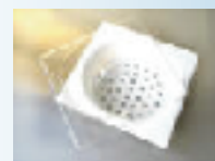
Cesto e Tampa